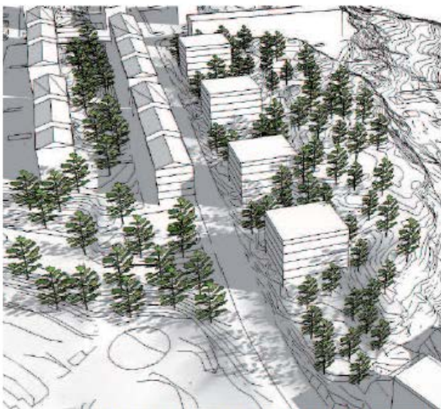
Bebyggelseförslag med ett antal punkthus mot Ulfsparrégatan