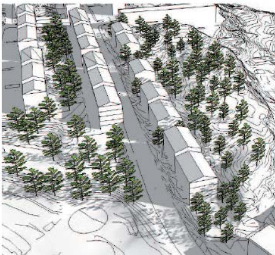
Bebyggelseförslag med lamellhus parallellt med Ulfsparrégatan